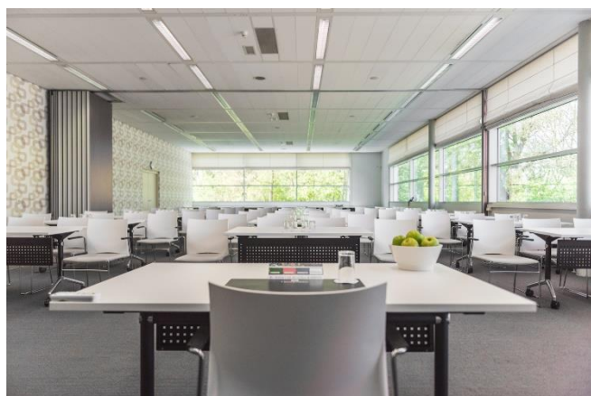
Conferentiezaal I + II – Hotel Groningen Plaza