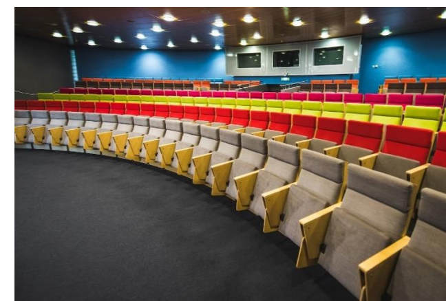
Auditorium – Hotel Groningen Plaza