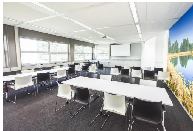
Leekstermeerzaal – Hotel Groningen Plaza